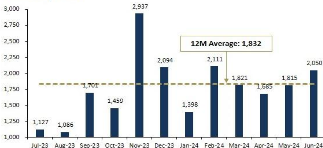
Gambar I.1 Baltic Dry Index

Baltic Dry Index (BDI), merupakan barometer penting untuk melihat kesehatan perdagangan global. Indeks ini memiliki keterkaitan erat dengan nilai perusahaan terutama di sektor manufaktur dan pertambangan, karena biaya pengiriman mempengaruhi profitabilitas, arus kas, dan daya saing perusahaan. Pada November 2023: BDI Puncak (2.937), indikasi permintaan pengiriman tinggi, yang berarti harga komoditas tambang mungkin naik (menguntungkan sektor pertambangan). Namun, produsen yang mengandalkan impor bahan baku mengalami kenaikan biaya, yang dapat menurunkan margin keuntungan. Sementara itu, pada Januari 2024: BDI turun (1.398), mengindikasikan bahwa biaya pengiriman rendah, menguntungkan sektor manufaktur karena biaya produksi lebih murah. Namun, jika penurunan disebabkan oleh melambatnya dinamika perdagangan global, permintaan terhadap barang manufaktur dapat melemah.